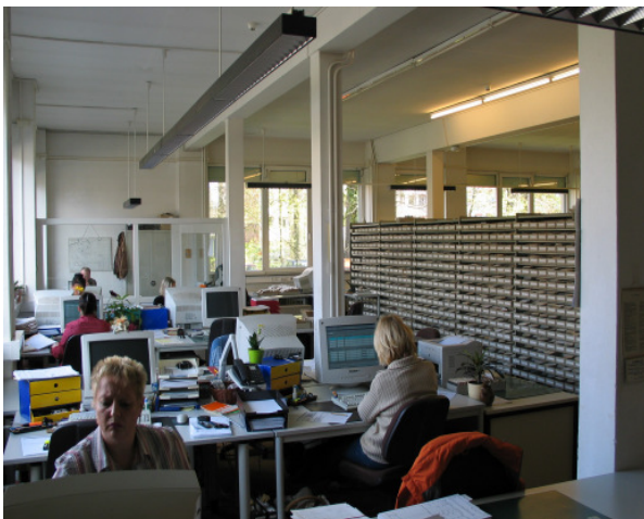
Ursprünglicher Dokumenten- und Arbeitsraum der Zentralen Namenkartei

Die dadurch freigewordenen Räume in den oberen Stockwerken im Haus am Park konnten mit Mitarbeitern, die ihren Arbeitsplatz im großen Dokumentenraum der