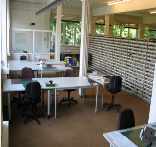
In der Mitte des Berichtsjahres fand - nach und nach - der Umzug der Karteiprüfer in die oberen Stockwerke statt.