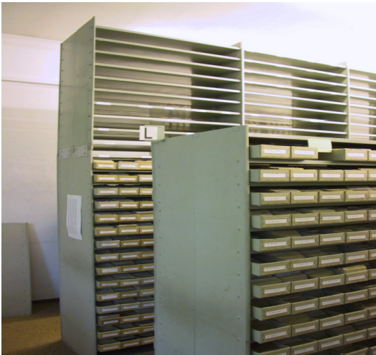
Unter Verwendung der abgebauten Regalteile erfolgte die Aufstockung der an der Wand stehenden Regale bis unter die Decke.