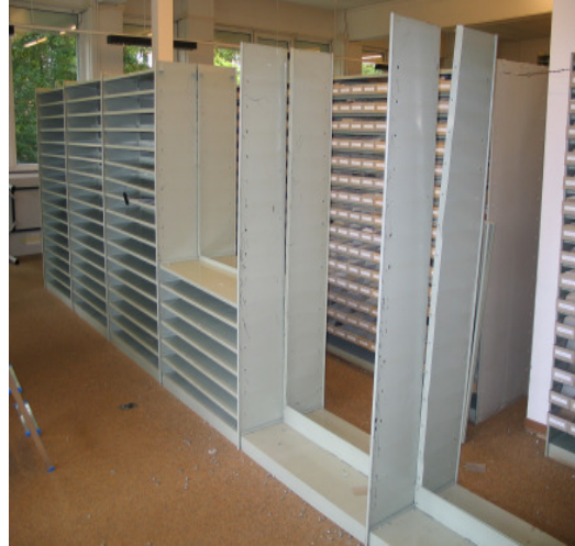
In der zweiten Hälfte des Berichtsjahres begannen ISD-Mitarbeiter damit, zwei Regalreihen auszuräumen, diese abzubauen und zu zerteilen.