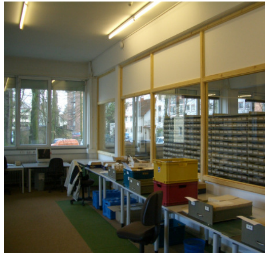
Der so gewonnene regalfreie Raum wird durch Errichten einer Glaswand gegen den verbliebenen Dokumentenraum abgegrenzt.

Da ein ehemaliger direkter Zugang von außen wieder geöffnet wird, bietet der neu gewonnene Raum eine optimale Voraussetzung, diesen zukünftig als Schulungsraum und auch als Lese-raum für Besucher zu nutzen.